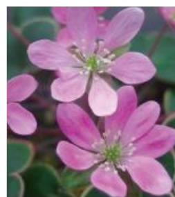
表題(愛称) 雪わり草